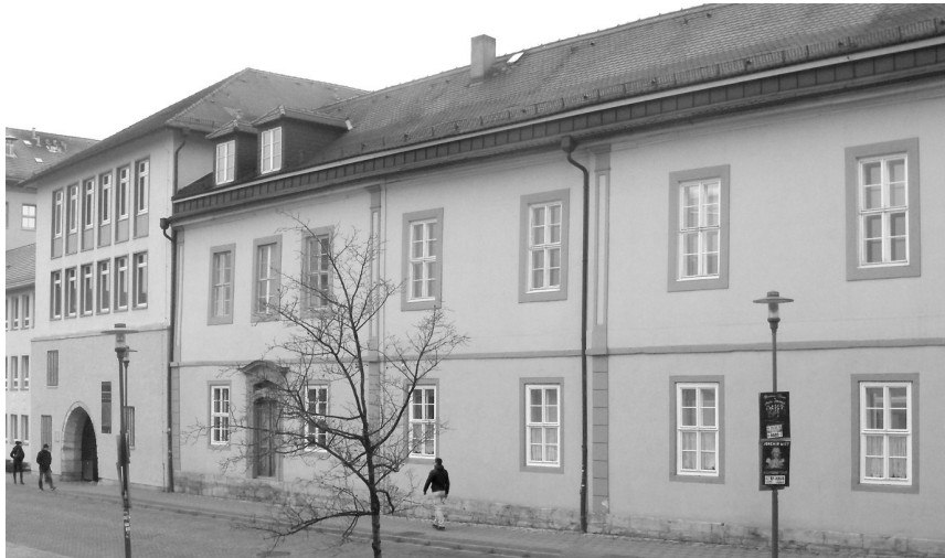
Abb. 1. Institutsgebäude von der Kollegiengasse aus gesehen